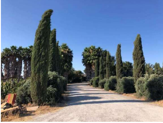
我们的 drive way