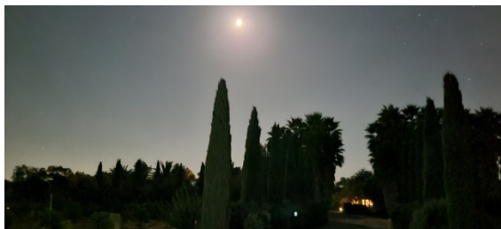
月光下的意大利柏树 1

一晃三年多过去了，这意大利柏树，还是那么挺拔，也没有什么变化，不用修剪，陪着树一起看日出，看晚霞，看蓝天看白云，看星星看月亮，有这意大利柏树的陪衬，所有的景色都会变得更美好！