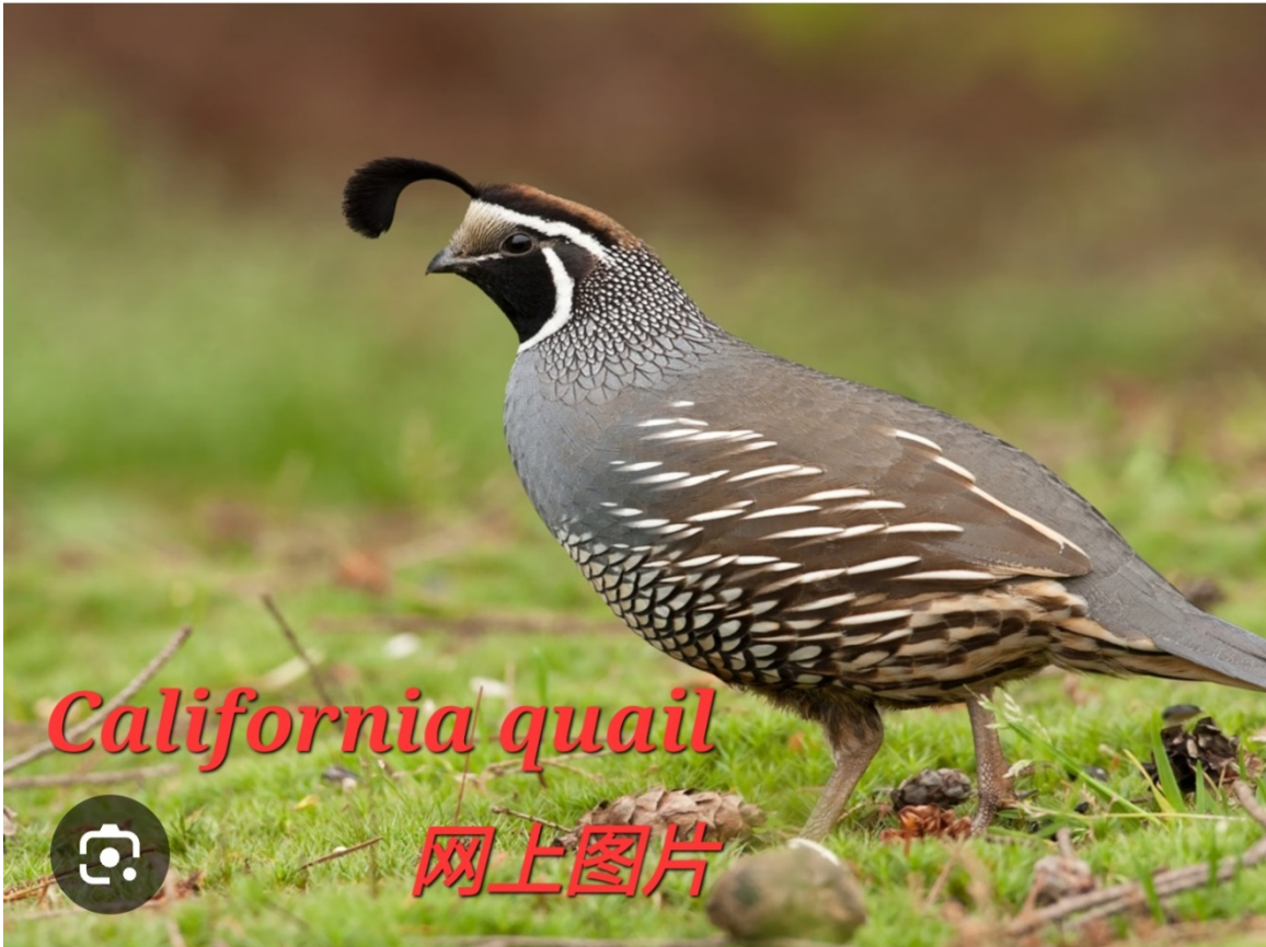
California quail, 网络图片