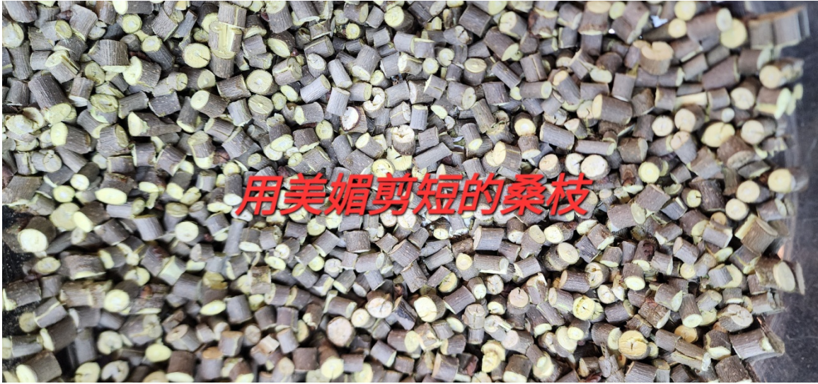
用美媚剪短的桑枝