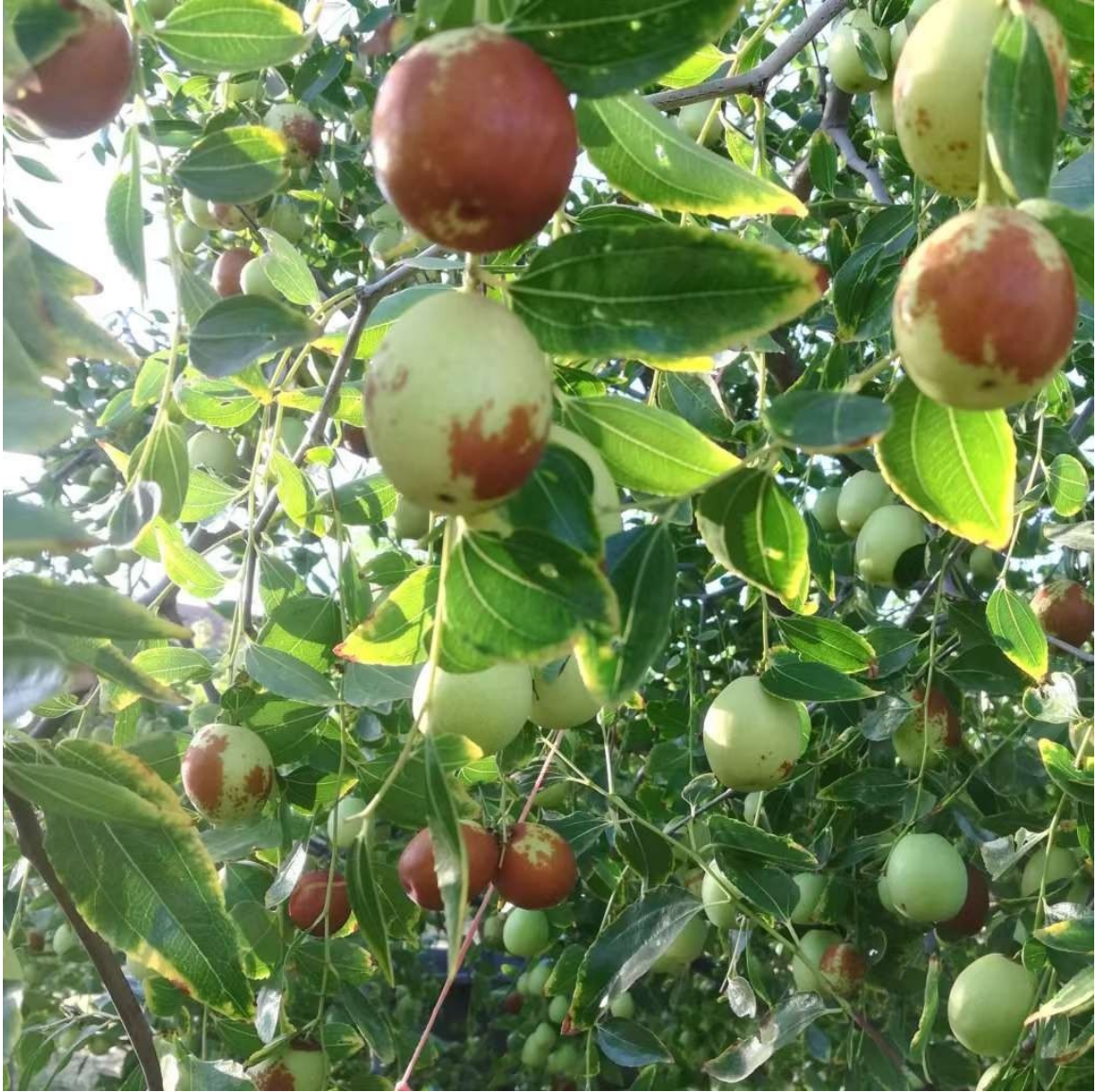
有机 sugar cane 鲜枣